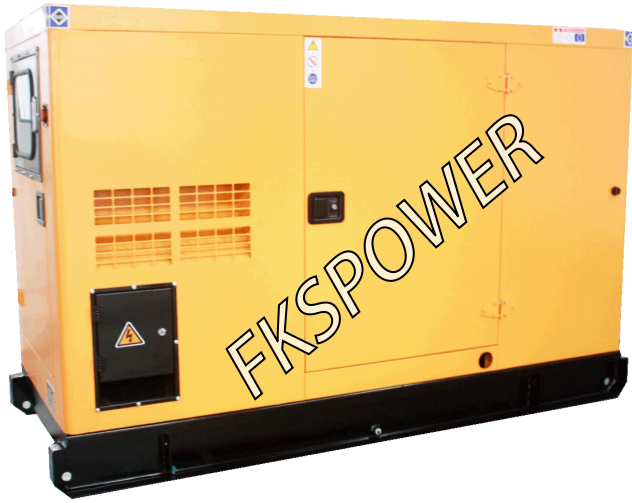
-----低噪音型发电机组