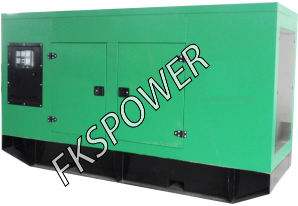
-----低噪音型发电机组