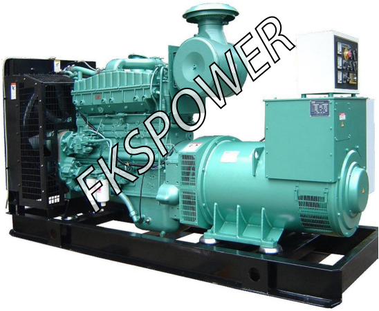
-----标准型开架式发电机组