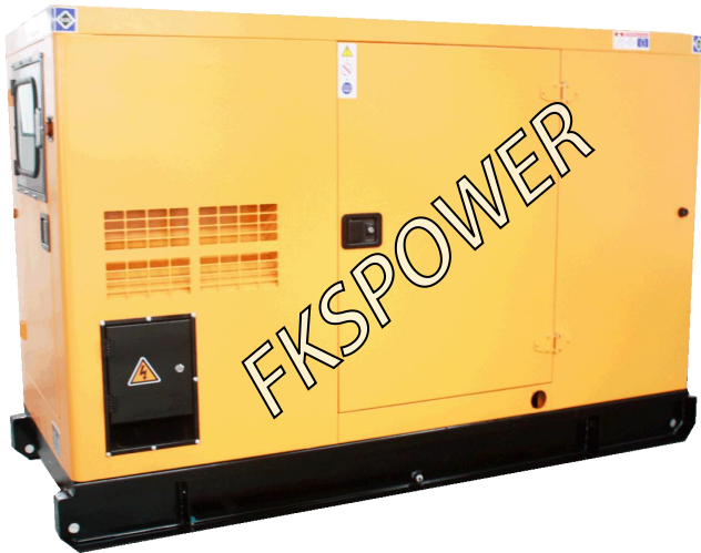
-----低噪音型发电机组