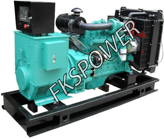
-----标准型开架式发电机组